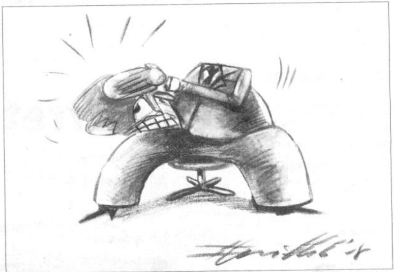
(Caricature: Florin Balaban)

et qui tentent de trouver ensemble des solutions. Outre le Luxembourg, l'Italie, la Lituanie, l'Allemagne, l'Espagne, l'Autriche, le Royaume-Uni, la France, les Pays-Bas et l'Irlande enverront demain un questionnaire sur l'impact des céphalées sur la vie quotidienne. Ce questionnaire (publié au Luxembourg en quatre langues différentes: français, allemand, anglais et portugais) est aussi bien adressé aux personnes souffrant de maux de tête qu'aux personnes qui n'en souffrent pas et permettra en-